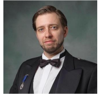
ロバート(ボブ)・ストックウェル